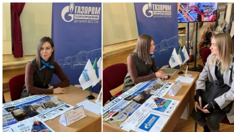
Газпром газораспределение Дальний Восток