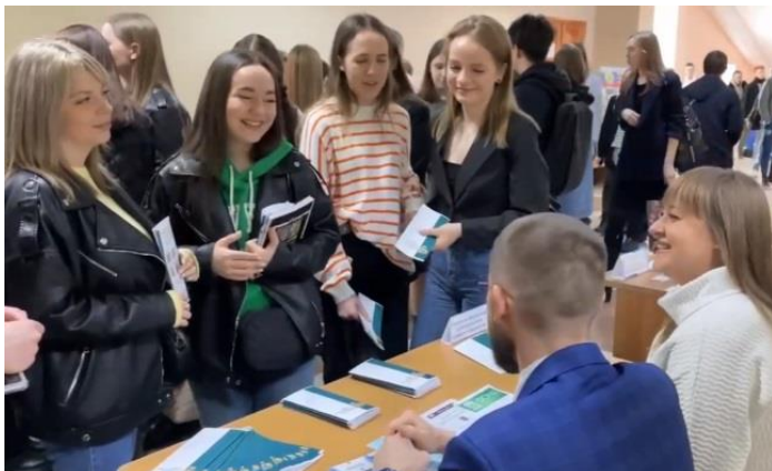
Хабаровское УФАС России